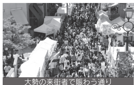
大勢の来街者で賑わう通り