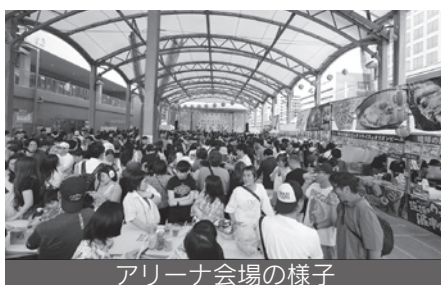
アリーナ会場の様子