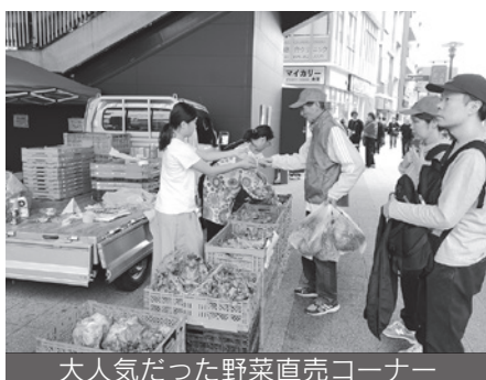
大人気だった野菜直売コーナー