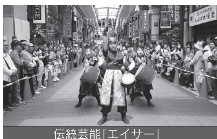
伝統芸能「エイサー」

また、川崎銀柳街を特別会場として、沖縄の伝統芸能「エイサー」による道ジュネー(練り行列)も実施され、迫力ある演舞が商店街を彩りました。開催期間中は好天にも恵まれ、川崎駅前一带が沖縄一色に染まり、終日多くの来場者で賑わうなど、大盛況のうちに終了しました。