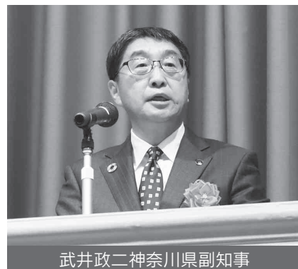
武井政二神奈川県副知事