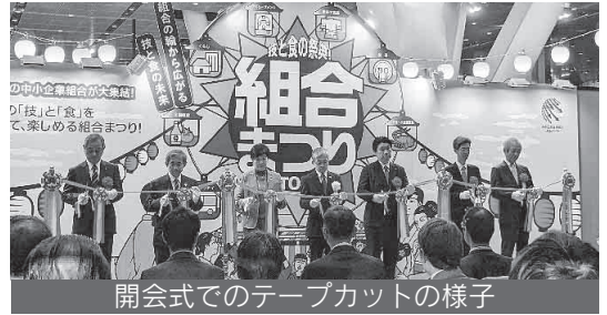
開会式でのテープカットの様子

なお、今年は県内より神奈川県旅館ホテル生活衛生同業組合、協同組合高津工友会、一般社団法人神奈川県洋菓子協会が出展を行いました。