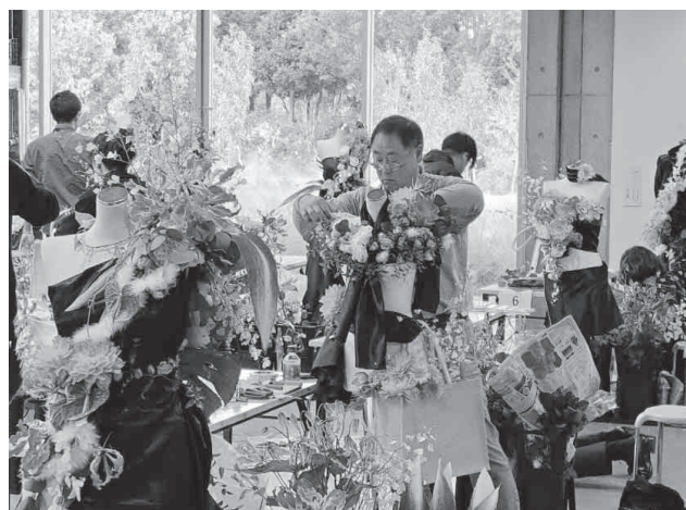
公開競技「ボディデコレーション」の様子

また、令和6年2月2日(金)～4日(日)に、横浜産貿ホールにて「花とみどりのフェスティバル」を開催します。どなたでも入場無料ですので是非ご来場ください。また、当日制作されたアレンジメント作品はお求めやすい価格にて希望者に販売致しますので、ご興味ある方は組合までお問い合わせください。