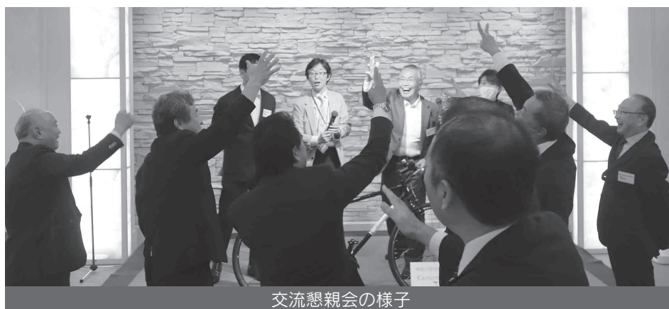
交流懇親会の様子

以上のような内容で本年度の中小企業団体交流大会も盛況に開催されました。ご参加いただいた皆様、ご講演・パネルトークにご協力頂いた皆様、誠にありがとうございました。