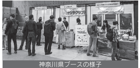
神奈川県ブースの様子