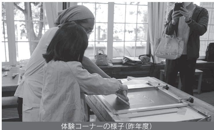
体験コーナーの様子(昨年度)

当日は職人の指導のもと、作品を製作できる体験コーナーや職人技の実演、作品の展示販売などが行われます。ステージイベントでは神奈川県家具協同組合による椅子張りの披露や神奈川県クリーニング生活衛生同業組合によるアイロンがけ実習が行われます。物品販売も行われ、神奈川県スクリーン・デジタル印刷協同組合によるベトナム産コーヒーの販売や手縫いの上敷ゴザ・畳資材で作ったトートバッグや小物などが販売されます。体験コーナーによっては事前予約が必要な場合がございますので詳しくはHPをご確認ください。