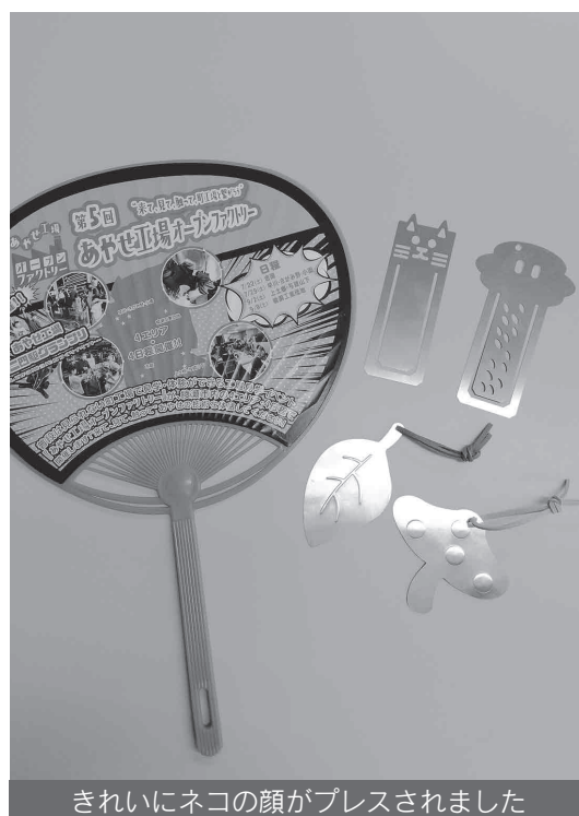
きれいにネコの顔がプレスされました