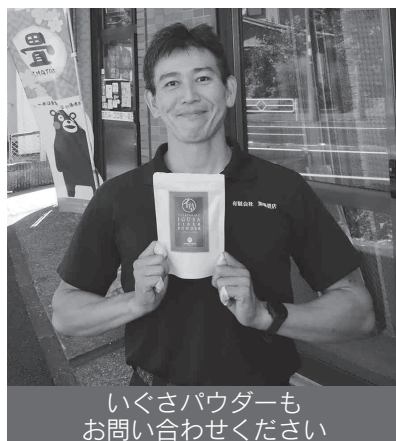
いぐさパウダーも お問い合わせください