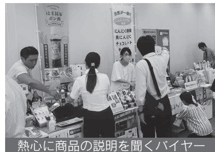
熱心に商品の説明を聞くバイヤー

開催後の出展者からのアンケートでも93%がバイヤーとの面談を行うことができイベントの満足度は高く、次回も参加したいという声が多く聞かれました。