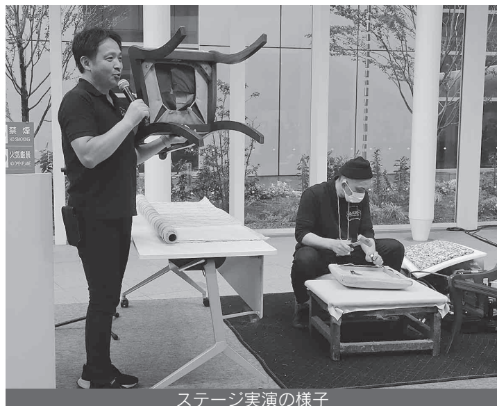
ステージ実演の様子

ステージイベントでは職人による家具リペアの実演会を開催、家庭でできる床リペアや家具の修理などが紹介され、ダイニングチェアの張替えでは手際よくシート部を交換していく様子に来場者も熱心に見入っていました。本展示会後も組合や組合員へ、一般のお客様からの問い合わせが増えているとのことでした。