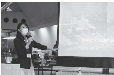
【トークイベントの様子】