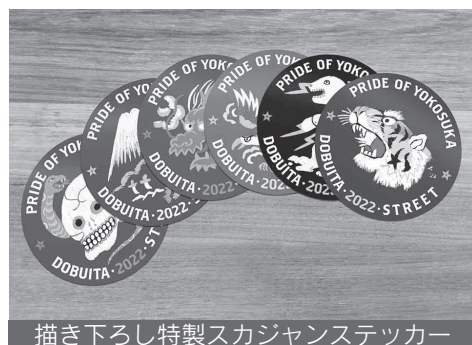
描き下ろし特製スカジャンステッカー