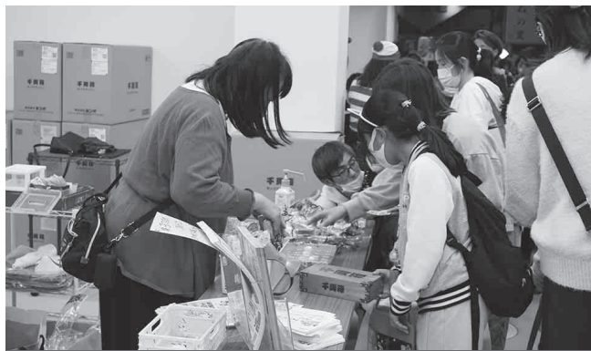
【スタンプラリー景品交換の様子】 大好評のスタンプラリーでは、 景品交換所に長い列ができました！

令和4年10月29日(土)に、衣笠商店街振興組合・衣笠仲通り商店街協同組合にて「衣笠ハロウィン2022 三浦おおすけ祭り」が開催されました。当日は、模擬店の出店他、ハロウィンスタンプラリーやハロウィン武者行列等が行われ、商店街を訪れた多くの人々がイベントを楽しみました。