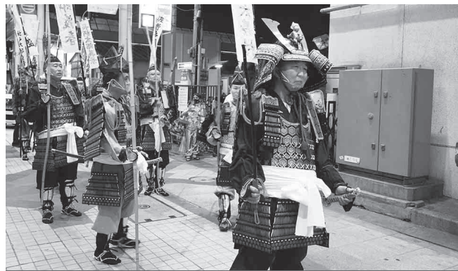
【ハロウィン武者行列】 「三浦一党武者行列」で使用される甲冑を身に着け、 13人の武者が商店街を歩きました。