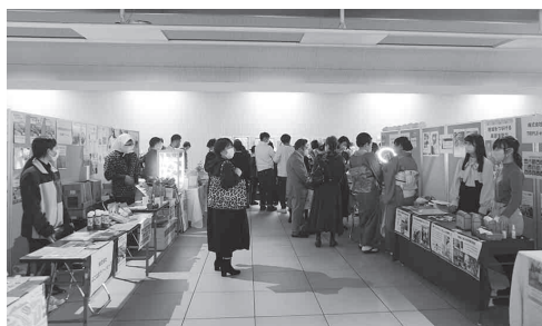
【展示・販売の様子】

令和4年10月29日(土)に、みなとみらい駅イベント広場未来チューブにて「ヨコハマ SDGs 文化祭2022」が開催されました。当日はSDGsを実践する企業によるトークイベント他、商品の販売・展示が行われました。トークイベントには、エコアクション21認証・登録企業の株式会社オオスミと株式会社キクシマが参加し、「脱炭素に向けた取組み」をテーマに講演を行いました。