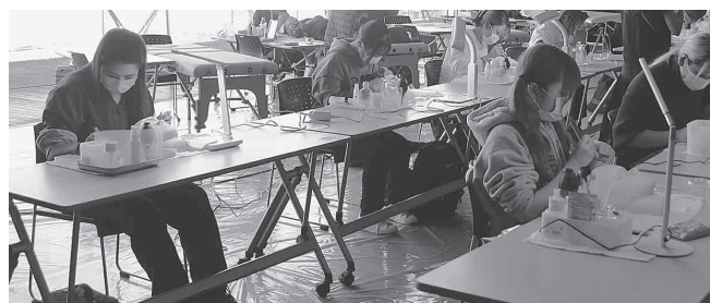
コンテストで競い合う参加者