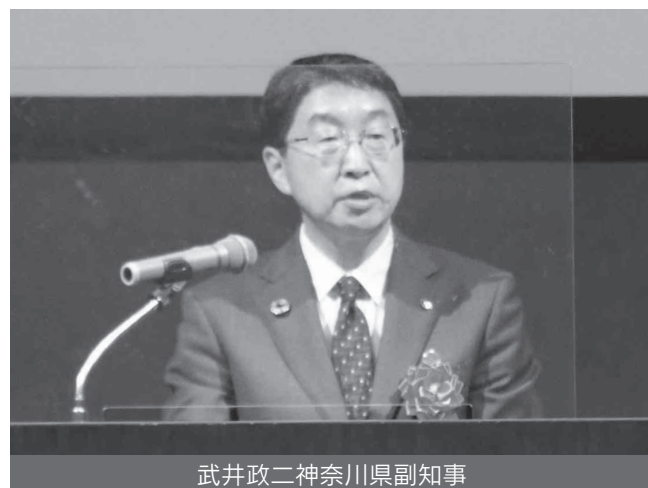
武井政二神奈川県副知事