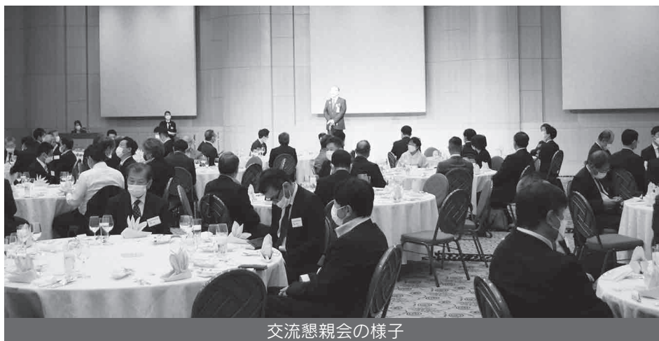
交流懇親会の様子

以上のような内容で本年度の中小企業団体交流大会も盛況に開催されました。ご参加いただいた皆様、ご講演・パネルディスカッションにご協力頂いた皆様、誠にありがとうございました。