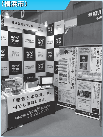
株式会社ツジマキ (横浜市)