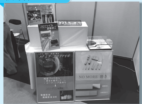
株式会社アピック (川崎市)