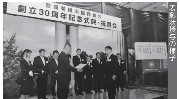
表彰状授与の様子