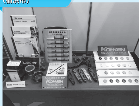
株式会社コーケン (横浜市)