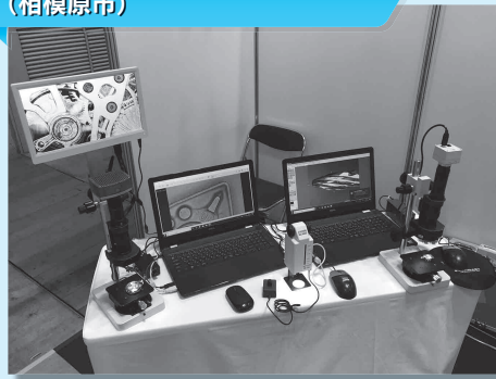
マイクロ・スクエア株式会社 (相模原市)