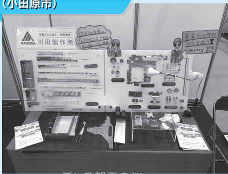
有限会社川田製作所 (小田原市)