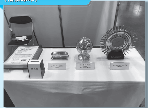
湘南デザイン株式会社 (相模原市)