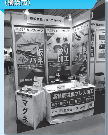
株式会社キョーワハーツ (横浜市)