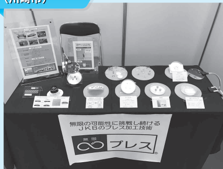
株式会社 JKB (川崎市)