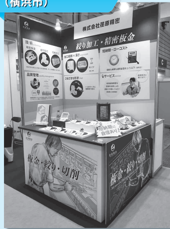
株式会社荏原精密 (横浜市)