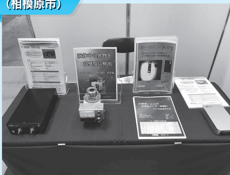
有限会社啓 (相模原市)