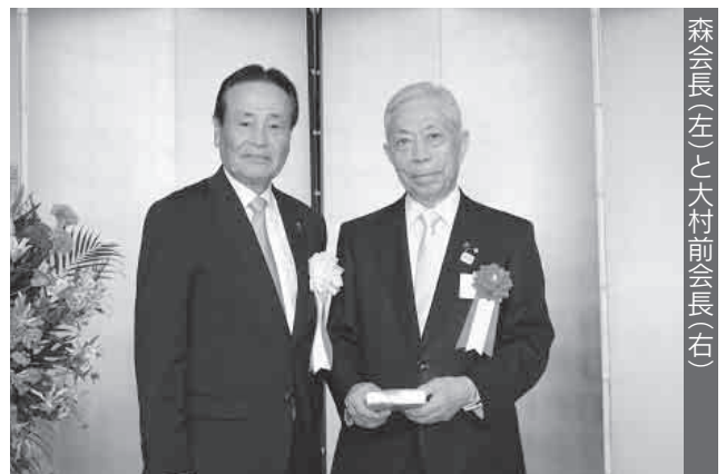
森会長(左)と大村前会長(右)

大村前会長よりバトンを引き継いだ森会長は「本日までご出席いただきましたご来賓並びに参加者の皆様には心から感謝を申し上げます。私も、中小企業・小規模事業者が、本当に元気になれば、日本経済再生はありえません。足元を見ますと、深刻化する人手不足問題や事業承継問題、消費税増税、最低賃金引き上げ等、我々を取り巻く環境は大変厳しい環境にあります。これを一つ一つ、丁寧に、取りこぼさずに、いかに、中小企業・小規模事業者のためになるかということを模索して取り組んでいきたいと思っています。そのためには、全国中央会が頼られる団体でなくてはなりませんし、各都道府県中央会とも、十二分に連携を図っていく所存です。」と感謝の意を表し、決意を新たにしました。